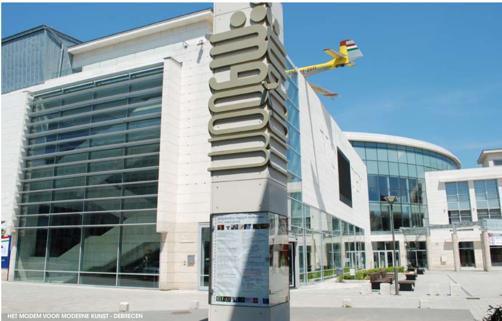
HET MODERN VOR MODERNE KUNST - DEBRECEN