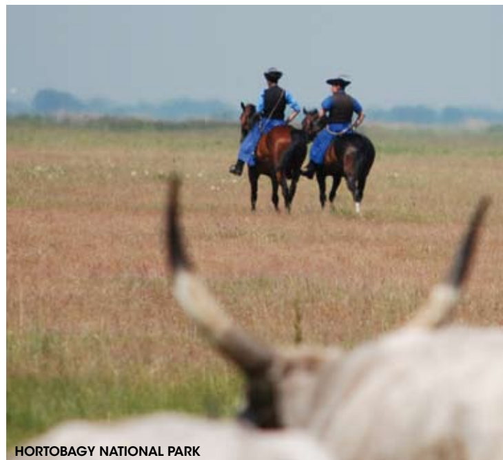
HORTOBAGY NATIONAL PARK