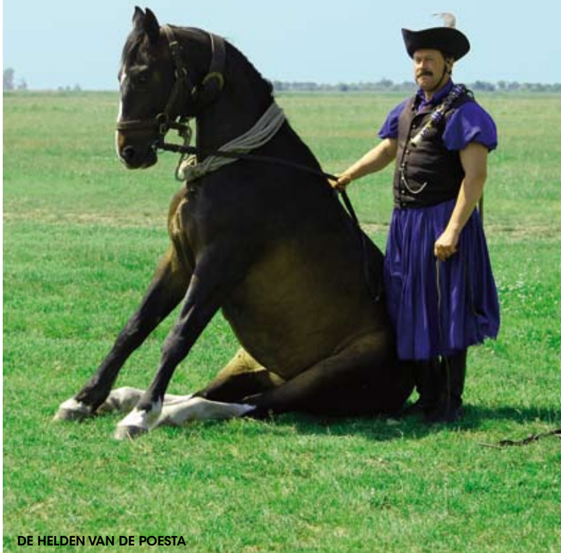
DE HELDEN VAN DE POESTA