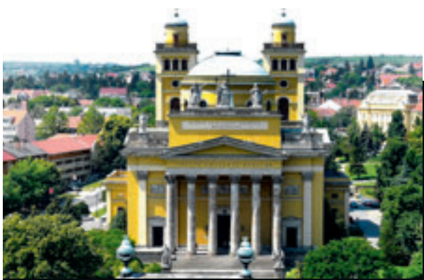
De monumentale basiliek van Eger.