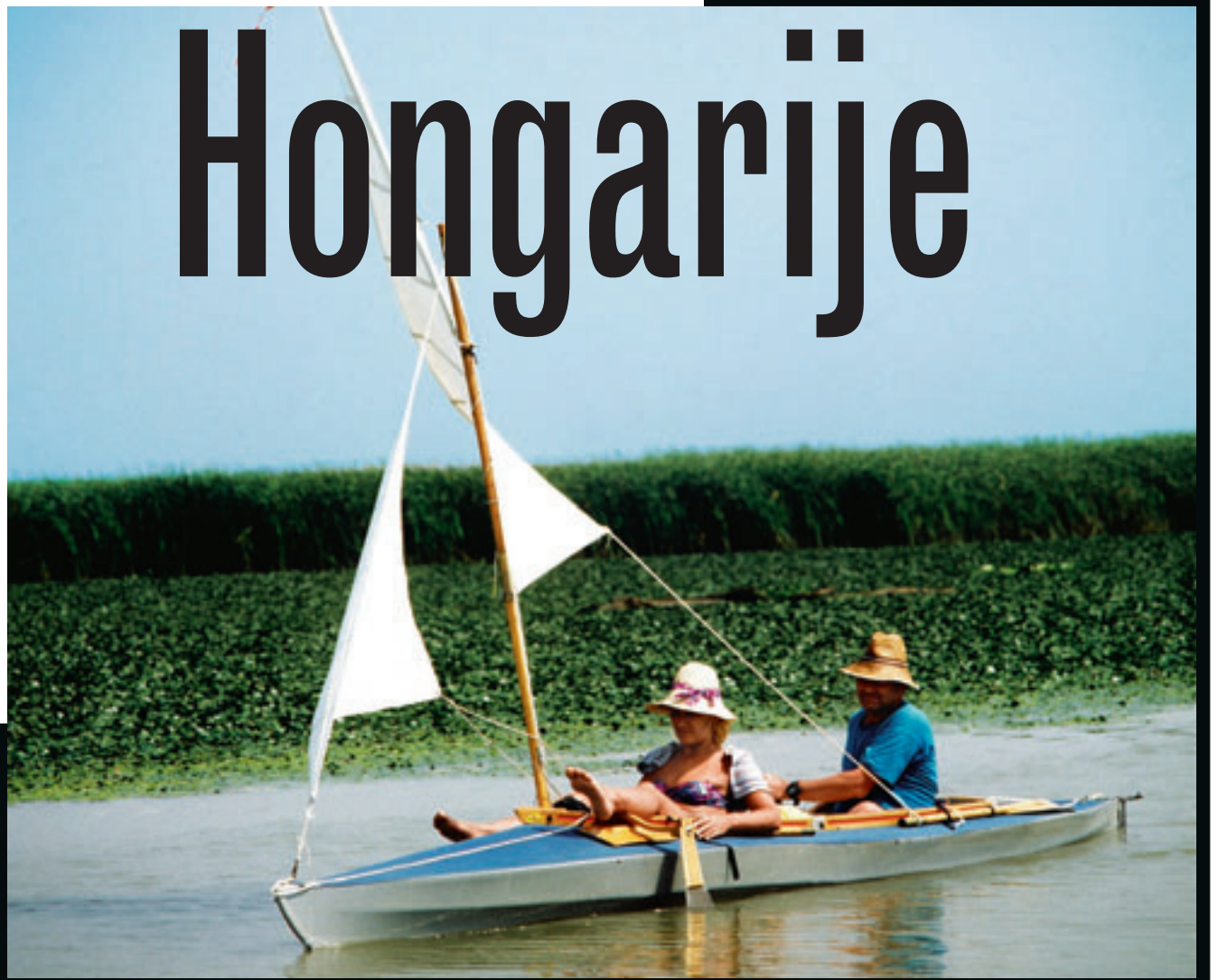
Tijdens het varen hoor je hier alleen maar de rustgevende geluiden van vogels en insecten.