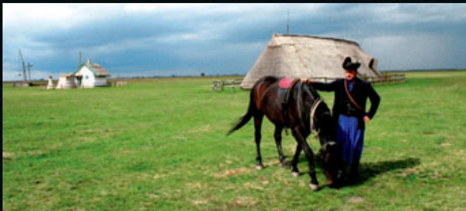
Midden in de steppe tonen de csikós hun kunstjes.